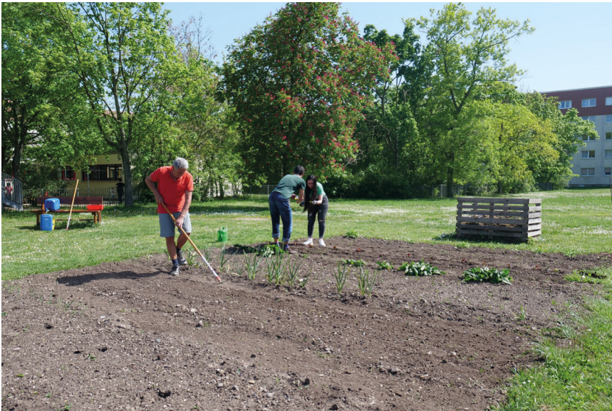
Mitstreiter:innen des Urban Gardening Projekts während der sogenannten Ackersprechstunde

Pünktlich zum Jahreswechsel hat der Bauverein die Wohnhofgestaltung an der Theodor-Storm-Straße abgeschlossen. Auf knapp 15.000 Quadratmetern wird Mieter:innen und Nachbar:innen künftig Raum zur Begegnung, Erholung und urbanen Landwirtschaft ermöglicht. In die ehemalige Abbruchfläche, die zuletzt als Hundewiese gedient hatte, wurden in den vergangenen Jahren knapp 450.000 Euro investiert. 180.000 Euro wurden dabei als Fördermittel von Bund, Land und Stadt bezuschusst. Neben Sitz- und Liegemöglichkeiten zum Entspannen wurde ein Klettergerüst errichtet, was von den Kindern der angrenzenden Schule und Kita begeistert in Empfang genommen wurde.