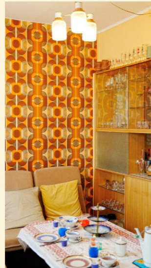
1970er-Flair in der Modellwohnung des Bauvereins Halle: Ein Blick in vergangene Wohnwelten.

Am Bruchsee ließ sich zudem anschaulich zeigen, dass aktuelle Ideen zur Entwicklung von Bergbaufolgelandschaften historische Vorläufer haben. Allerdings haben sie heute aufgrund der gesellschaftlichen Rahmenbedingungen eine andere Verknüpfung mit dem städtebaulichen Umfeld erhalten. So wurde der ehemalige Kalksteinbruch einst geflutet und als Sonnen- und Schwimmbereich am Rande von Nietleben genutzt. Heute liegt er eingebettet zwischen Nietleben, der nördlichen Neustadt und Heide-Süd – also mitten in der Stadt. Aktuell entsteht dort ein neuer Erlebnisspielplatz, der den Titel „Vernetzung und Spielplatz am Bruchsee“ trägt und gestalterisch die geologische Geschichte des Ortes aufgreift. Das zentrale Thema „Urzeitmeer“ verweist auf die Muschelkalk-Schichten der Region – Überreste eines urzeitlichen Meeres, das große Teile Mitteldeutschlands bedeckte. Von dort führte die Tour zurück ins Zentrum der Neustadt. Auf dem Stadtplatz wird die vielschichtige Geschichte des Stadtteils besonders sichtbar. Ähnlich wie auf dem Marktplatz in der Innenstadt Halles, wo unterschiedliche Bau- und Zeitepochen ablesbar sind, lassen sich auch hier Vergangenheit und Gegenwart gut nachvollziehen – wenn auch in einem deutlich jüngeren zeitlichen Rahmen. Vom nicht fertiggestellten Rathaus über die heutige Nutzung als Landesamt für Vermessung und Geoinformation, die sanierte Scheibe A, die im Bau befindliche Scheibe C, das Neustadt Centrum, den