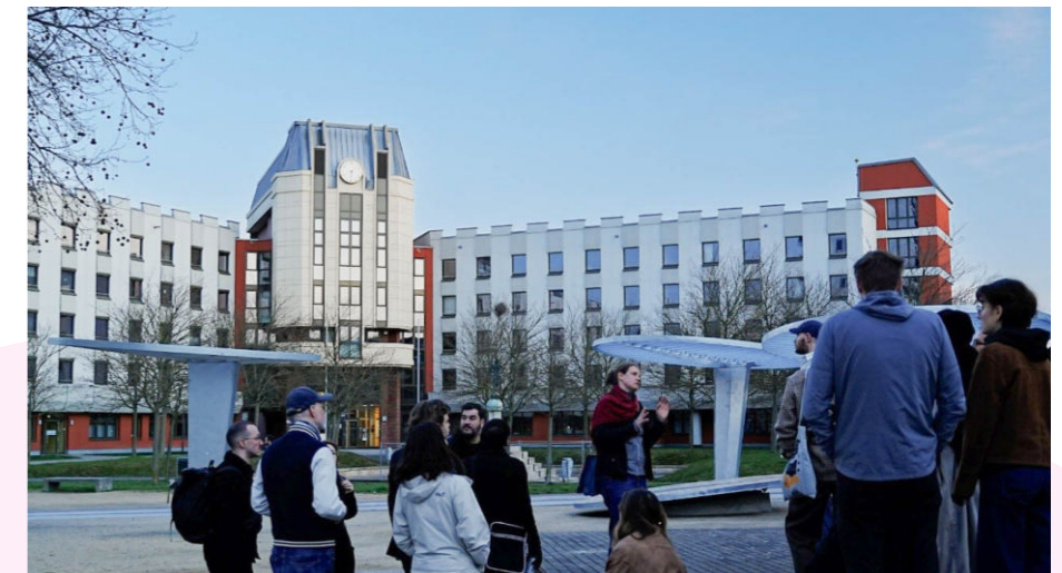
Stadtteilgeschichte im Blick: Die Tourgruppe vor dem ursprünglich als Rathaus geplanten Landesamt und den neuen Reißzwecken.

Weiter ging es mit der Straßenbahn vom neuen Modell TINA bis zur Haltestelle Schwimmhalle und von dort in Richtung Bruchsee. Am Giebel der Schwimmhalle begann der zweite thematische Teil der Tour mit dem Schwerpunkt Kunst und Kultur in