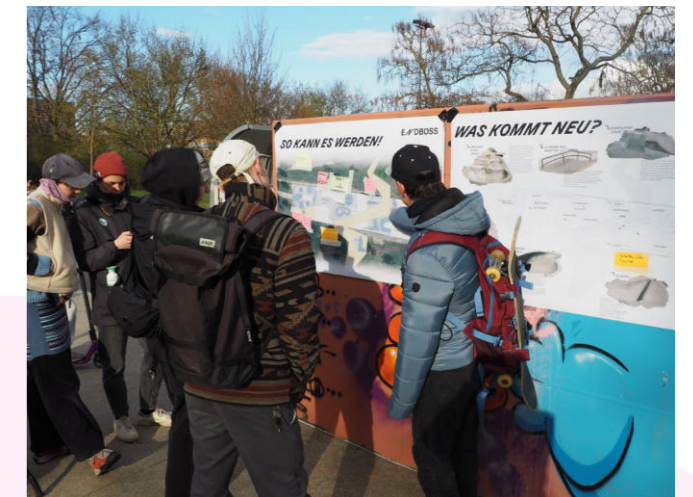
Im Gespräch: Beim Beteiligungstermin im März 2026 wurde der auf den Ergebnissen von 2023 basierende Vorentwurf des Planungsbüros „Endboss“ gemeinsam diskutiert und weiterentwickelt.

Umfeld besprochen. Die weitere Planung soll nun schrittweise fortgesetzt werden. Ziel ist es, die Entwurfsplanung bis zum kommenden Jahr weitgehend abzuschließen. Der Baubeginn hängt anschließend von den weiteren Genehmigungs- und Abstimmungsprozessen ab.