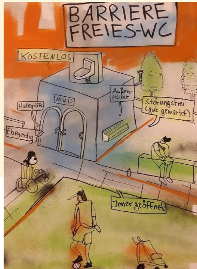
Ideen wurden sichtbar: Bei der Beteiligung 2023 brachte der Künstler Gunther Schumann mithilfe der Methode „Graphic Recording“ die Gedanken der Teilnehmenden direkt aufs Papier.

urbane Straßenräume) geplant: Hier wird die Fläche angehoben, sodass der große „Bowl“ (übersetzt: tiefe, schüsselförmige Skatefläche zum Fahren in Kurven und Wellen) geschlossen, aber auch ein barrierefreier Zugang geschaffen wird. Der „Wellenweg“ im Eingangsbereich soll